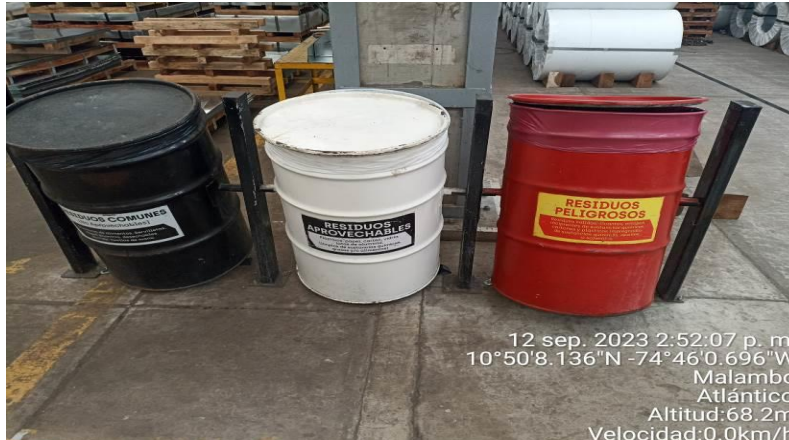
Tomada 12 de septiembre de 2023

“POR MEDIO DE LA CUAL SE DECLARA LA PÉRDIDA DE EJECUTORIEDAD DE LA RESOLUCIÓN No. 000165 DE 2002 A TRAVÉS DE LA CUAL SE ESTABLECE COMO OBLIGATORIO EL CUMPLIMIENTO DE UN PLAN DE MANEJO AMBIENTAL A LA SOCIEDAD ACEROS CORTADOS S.A.S., CON NIT. 800.189.687-3, UBICADA EN JURISDICCIÓN DEL MUNICIPIO DE MALAMBO, DEPARTAMENTO DEL ATLÁNTICO Y SE DICTAN OTRAS DISPOSICIONES LEGALES”