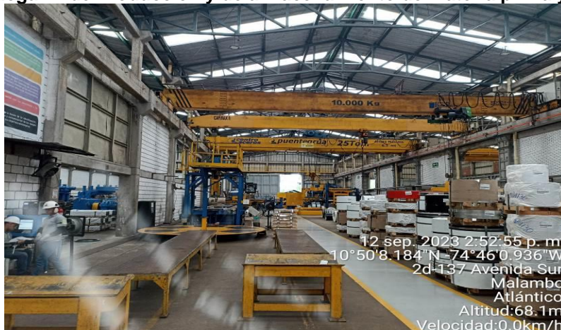
Tomada 12 de septiembre de 2023